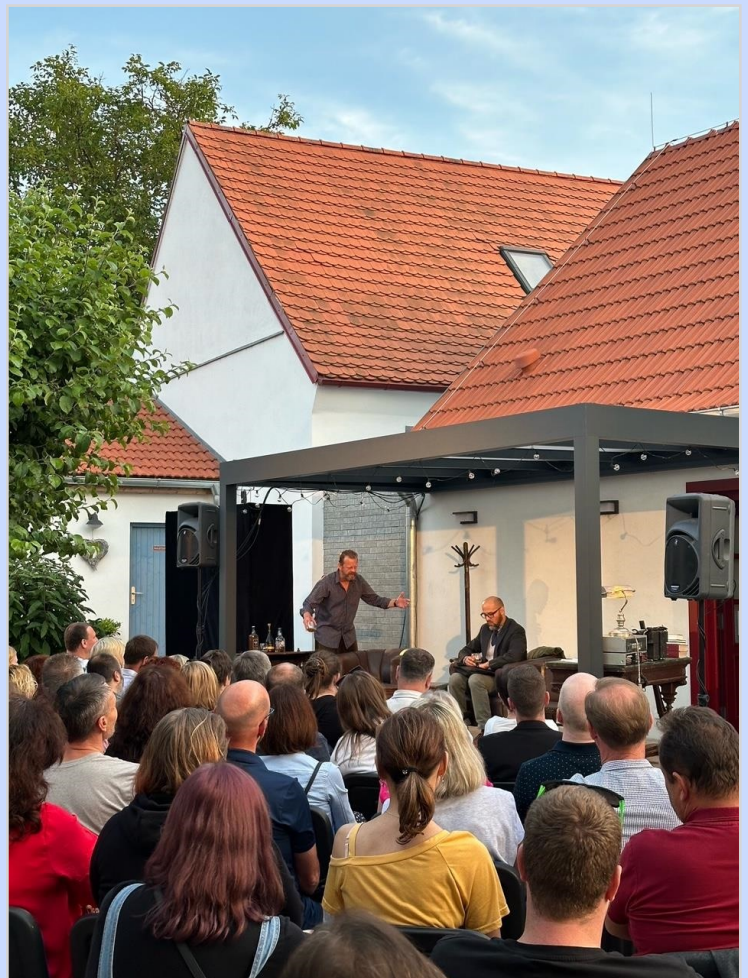
Enigmatické variace na Dvorečku

Všem žákům a studentům přeji krásné prázdniny a nám ostatním pěknou dovolenou. Ať se Vám letní plány podaří naplnit dle Vašich představ.