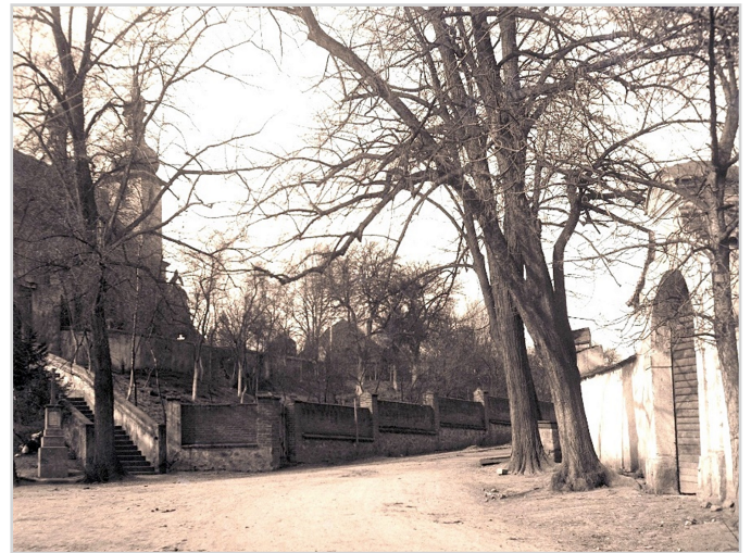
Lípy u kostela a fary kolem r. 1920

Ještě si mnozí pamatujeme na rok 2015, kdy jedna z velkých lip u kostela padla přímo do křižovatký poté, co jí uhnily kořeny. Nedbalá údržba, nešetné ořezávání, podkopávání kořenů, dláždění, či asfaltování chodníků skoro až ke kmeni - to bývá osudné mnohým prastarým a cenným stromům.