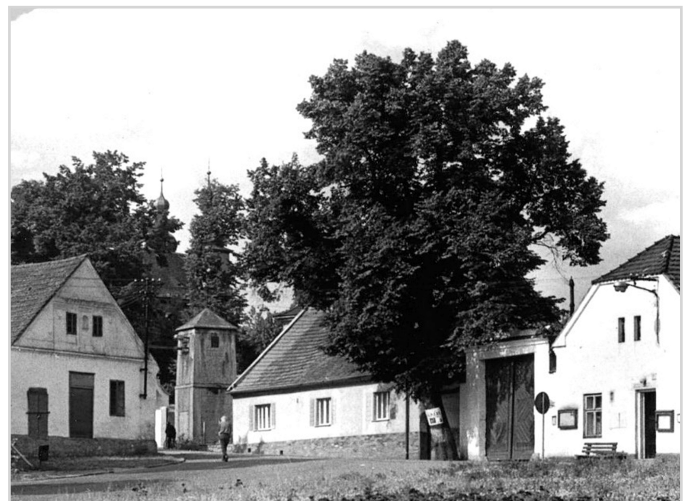
Lípa na návsi před dvorem čp.27 byla pokácena v devadesátých letech.