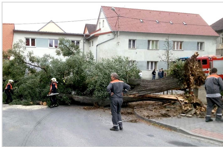
Odklizení lípy u kostela po jejím pádu v r. 2015