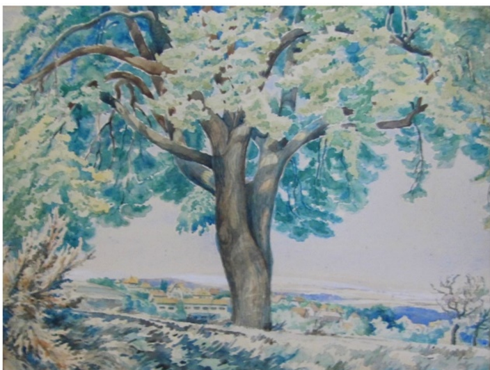
Stará lípa nad Dýšinou na obrázku Vladimíra Vraštila, v pozadí jsou zobrazeny budovy Armaturky

Strom byl kdysi srdeční záležitostí Dýšiňáků, lidé se u ní fotili a je také na obrázku od místního malíře Vladimíra Vraštila. Tomuto malíři lípy učarovaly, jsou na více jeho obrazech, namaloval například i lípy u kostela.