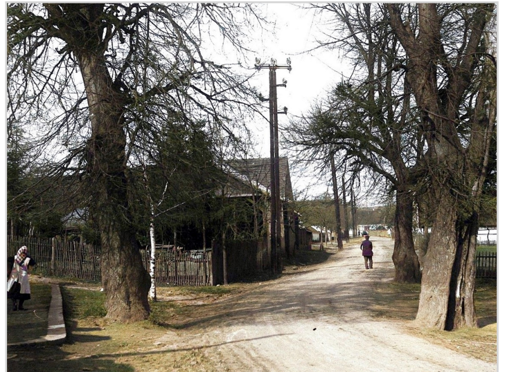
Prostor u dnešního Domu služeb, pohled od Nové Huti kolem r. 1920. Vlevo je dýšinská památná lípa.

Na fotografiích z roce 1932 ale vypadá památná lípa už také hodně velká, tedy mám za to, že je určitě o několik desetiletí starší, snad i vysazená ve významném roce 1848, jak se tradovalo. V těch místech bývalo celé stromořadí lip a v blízkosti památné lípy ještě tři další, rostly po dvou na každé straně cesty. V roce 1932, kdy se dělala nová cesta v místě dnešní křižovatky u Domu služeb, byly pokácené dvě lípy, aby se silnice mohla rozšířit.