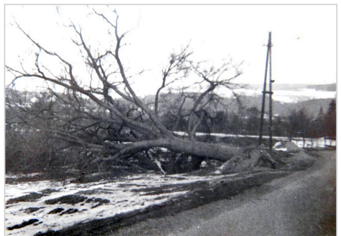
Prastará lípa nad Dýšinou, která padla při vichřici kolem r. 1955.