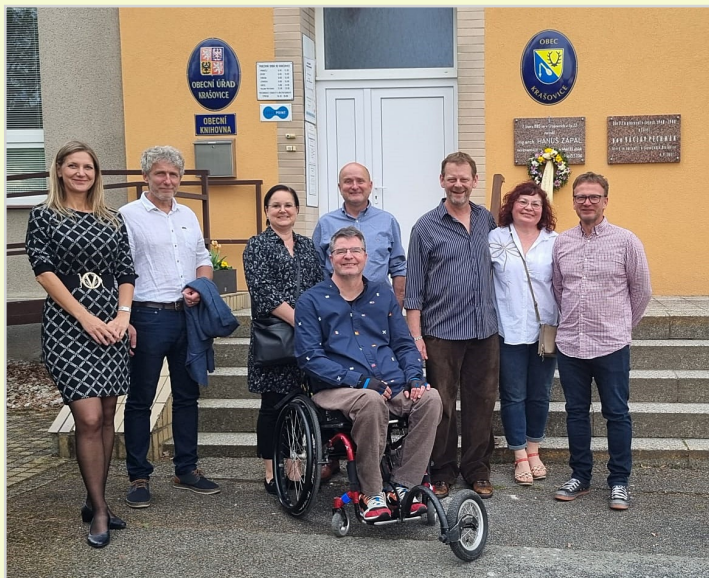
Setkání v Krašovicích