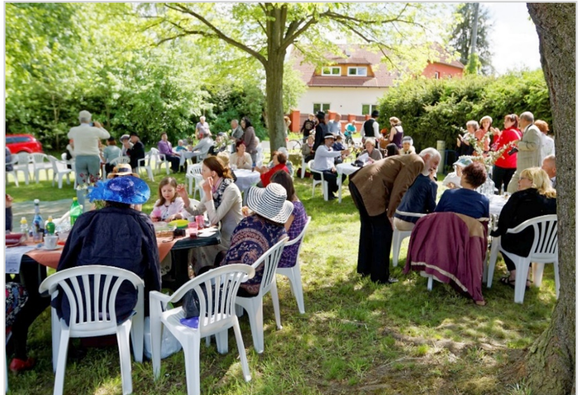
Pohoda pod lípami v Paškově parku v Nové Huti r. 2017