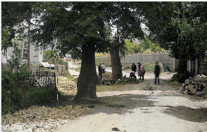
Stejně místo z opačného pohledu v roce 1932. Kácí se zadní lípa a staví nová cesta.

Ve stejné době ještě stála nad Dýšinou (u silnice nad cihelnou, dnešním fotbalovým hřištěm) lípa ještě mnohem starší a vzrostlejší, bezpochyby velmi krásná. Vyvrátila se vichřicí nedlouho poté, co jí byly v r. 1953 poničeny kořeny při stavbě vodovodu do Dýšiny. Tehdy prý odhadovali její věk podle letokruhů na tři sta let a vysoká byla kolem 39 m.