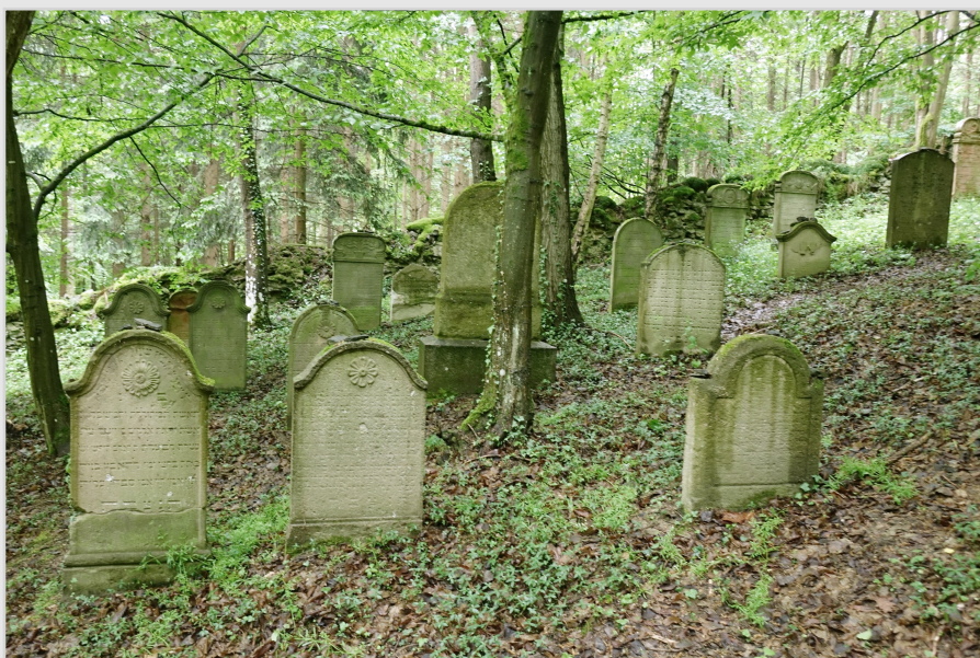
Židovský hřbitov v Hřešihlavech

V roce 1840 žila ve vsi více než polovina židovských obyvatel. V dolní části Hřešihlav je půvabná židovská ulička, sestávající z malých domečků nalepených na sebe. Tudy jsme sjeli údolím na místní židovský hřbitov, který je v poměrně strmé stráni. Je dobře opravený Federací židovských obcí Praha; před dolním vstupem je naučná tabule. Hřbitov je v rostlém lese, oplocený a dýchá zvláštní atmosférou.