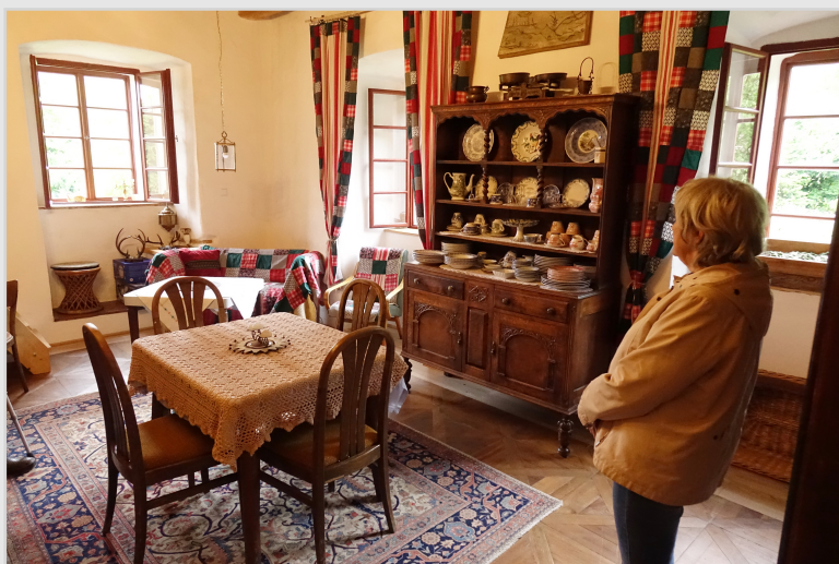
Interiér Tvrze Svinná