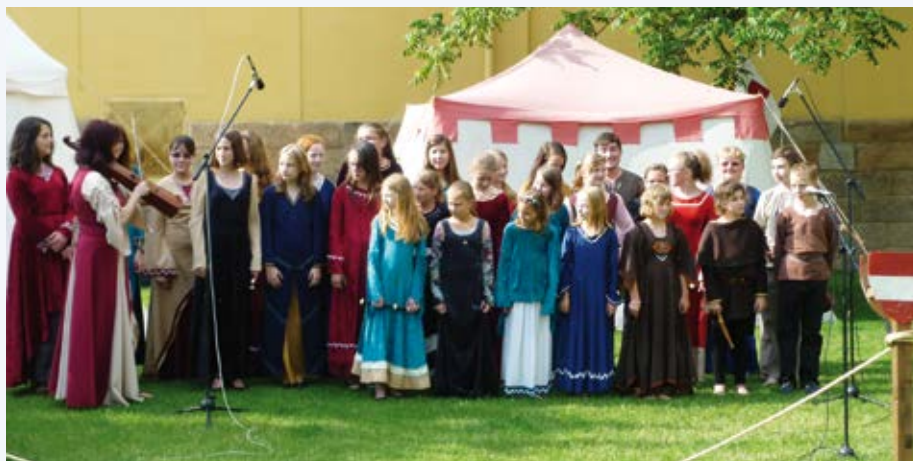
Gutta na Historickém víkendu v Plzni