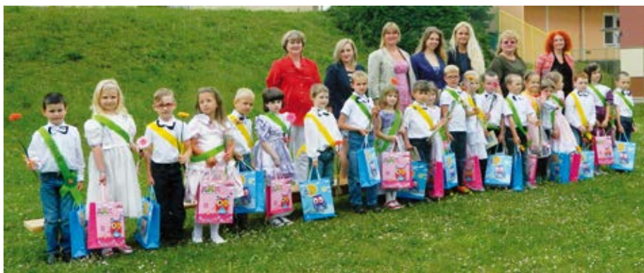
Učitelky dýšinské MŠ s dětmi, které po několika letech péče pošlou od září do lavic 1. třídy a do života školáků.