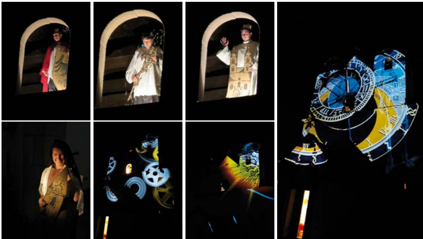
Kostel v Dýšině ozdobil na jednu jedinou noc v celé jeho historii atrakce, kterou se mohou pochlubit jen na několika místech na světě - orloj. Ten dýšinský byl navíc originální tím, že to byl orloj živý. O Noci kostelů, kdy se orloj roztočil, si můžete víc přečíst na straně 2.