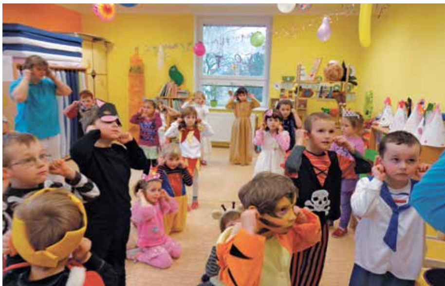
Děti z mateřinky při karnevalu.

Velké masopustní veselí vyvrcholilo průvodem masek. Dlouhý řetěz dětí (z MŠ a 4. tř. ZŠ) i dospělých vyšel od