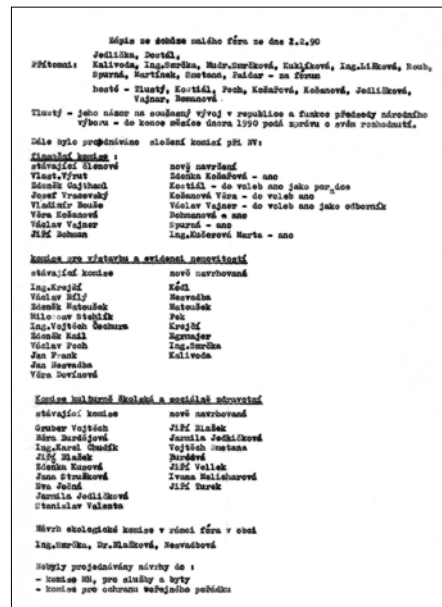
Historický dokument - návrhy Občanského fóra na nové členy komise OV v roce 1990.