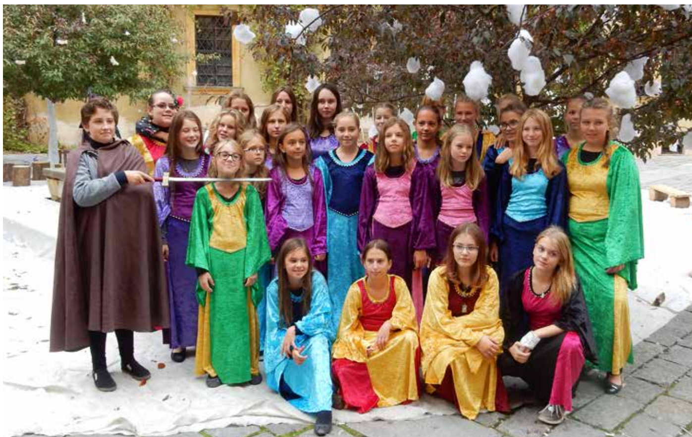
Pohádkový festival v Jičíně a dýšinská Gutta už patří nerozlučně k sobě. Jak se dařilo našim zpěvákům letos a jestli nikdo nepřišel o hlavu, se dozvíte uvnitř Zpravodaje.