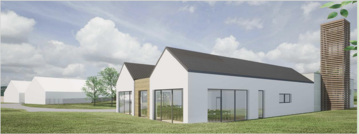
Architektonická studie stavby nové hasičské zbrojnice

Zastupitelstvo obce na svém zasedání dne 20. října 2025 schválilo pokračování v přípravě výstavby nové hasičské zbrojnice na návsi. Tato stavba patří mezi klíčové investice, které mají přispět nejen ke zvýšení bezpečnosti, ale také ke zlepšení zázemí pro naše dobrovolné hasiče. Ti jsou dlouhodobě oporou při mimořádných událostech i při společenském dění v obci. Aktuálně probíhá zahájení výběrového řízení na zhotovitele stavby.