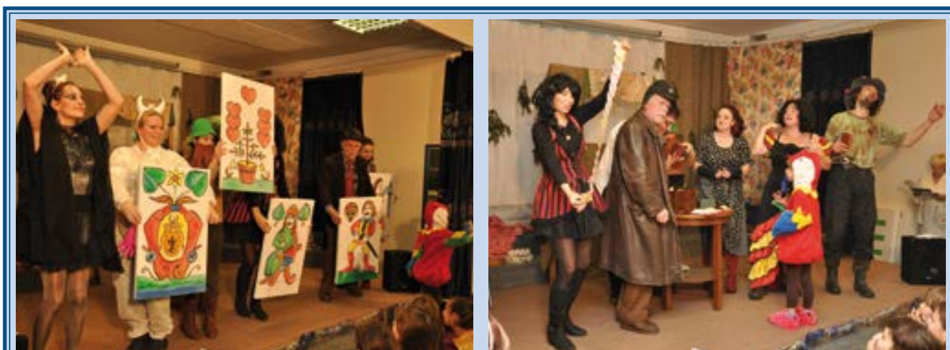
Malá vzpomínka na vánoční pohádku Zvířátka a Dýšinští. Luciferáci už tradičně pobavili děti i dospělé, a jak bylo vidět, bavili i sami sebe.