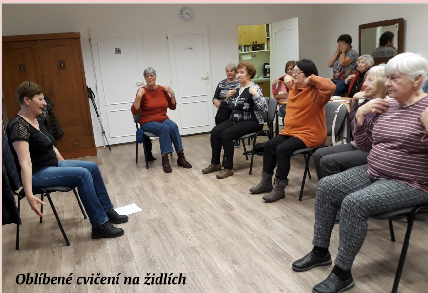
Oblíbené cvičení na židlích

Komunitní centrum Kyšice a jeho nejrůznější přednášky. Nezapomínáme ani na děti z mateřské školy a chodíme jim pravidelně číst pohádky.