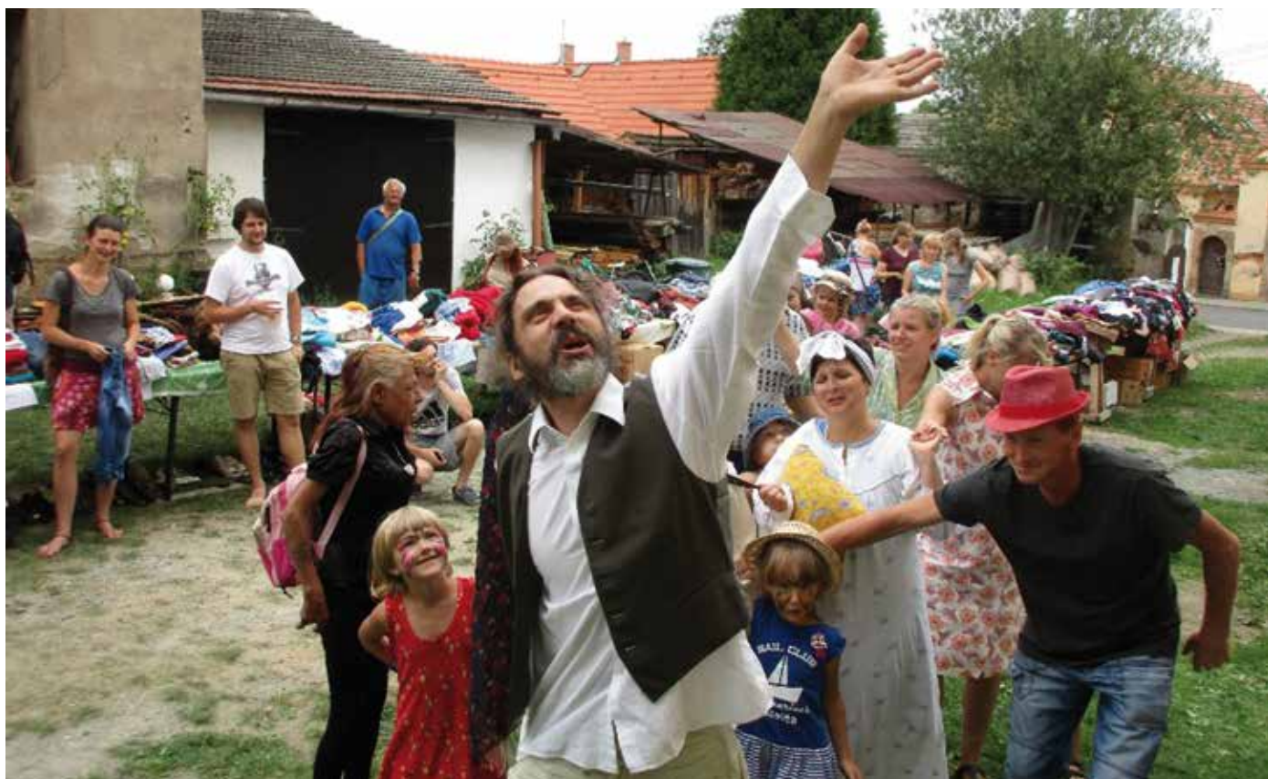
Pohádku o Jirkovi s kozou v nastudování místních ochotníků mohli letos vidět návštěvníci Bazaru naboso, který se konal uprostřed léta na dýšinské faře. Více o něm uprostřed Zpravodaje.