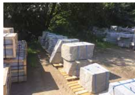
Připravené kameny v lomu Kozárovice.