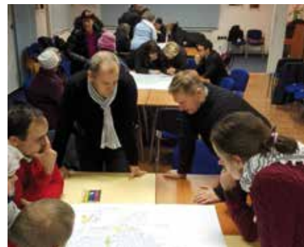
První veřejné setkání v rámci přípravy nového územního plánu obce.