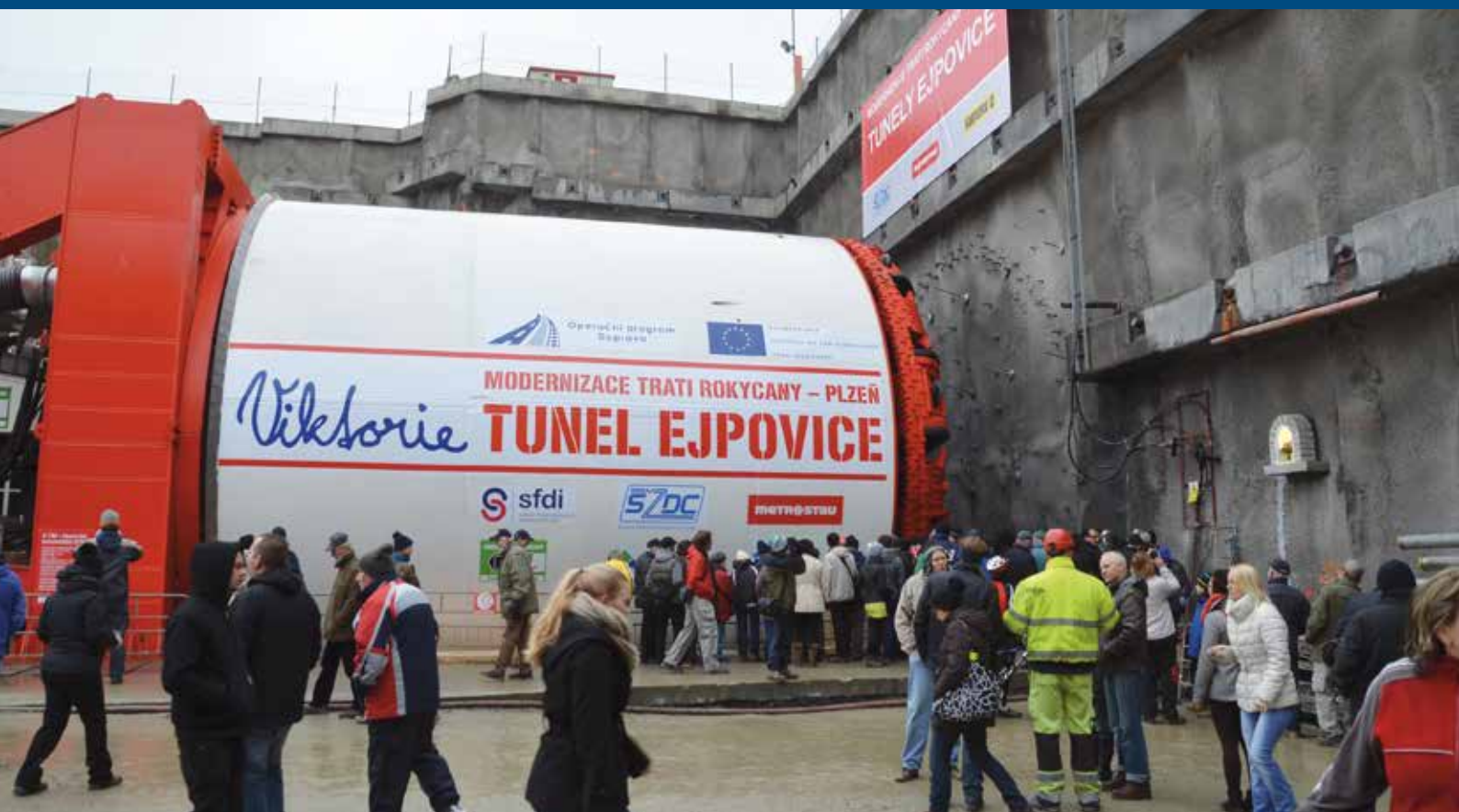
Razicí štít pokřtěný Viktorie byl hlavním tahákem dne otevřených dveří na stavbě tunelu Ejpovice. Přišlo se na něj podívat několik tisíc lidí. Více si přečtete na str. 4