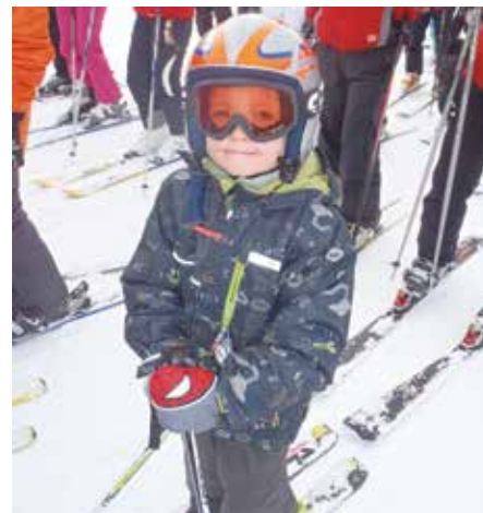
Nejmenší dýšínští lyžaři v akci.

Lyžařská škola z Dýšiny se stává mezi lyžaři v regionu už zase známou a uznávanou. Spousta Plzeňáků by k nám chtěla a mnozí již s námi jezdí. Samozřejmě, jsme levnější a poctiví, děláme to „zadara“ a z lásky. Co jiného by měl LO dělat? Jeho hlavním posláním je přece učit lyžovat a získávat pro to další generace. Nepíší to proto, abych se nepokrytě chlubil činností oddílu. Chtěla