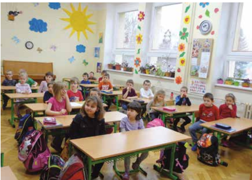
Před zápisem do první třídy, který se konal v polovině ledna, si vyzkoušeli předškoláčky, co je za pár měsíců čeká.