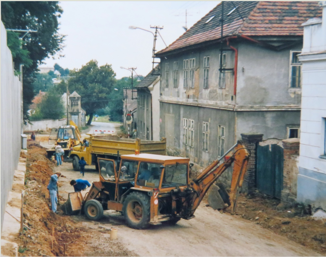
Rok 1992, opravy silnice a chodníku. Vzadu u silnice je vidět ještě lípa, která stávala před čp. 27.