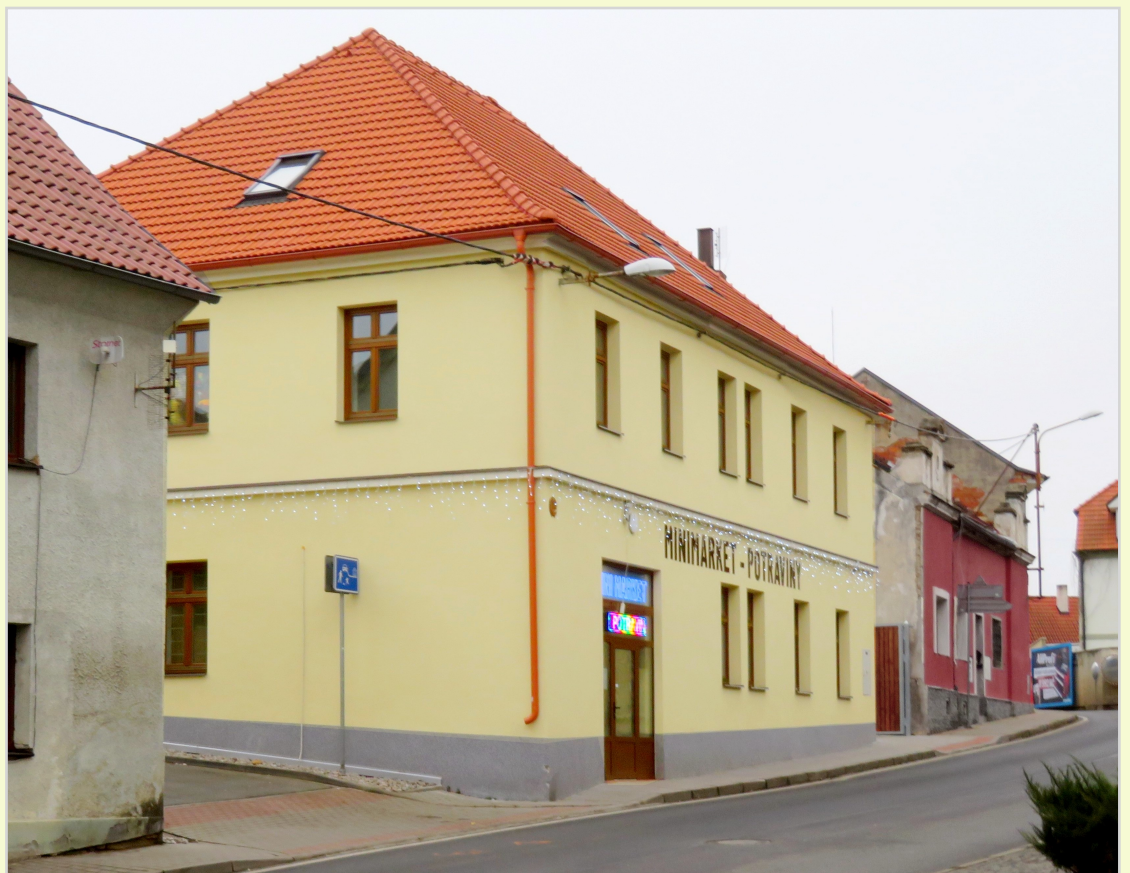
Opravený dům, prosinec 2025.