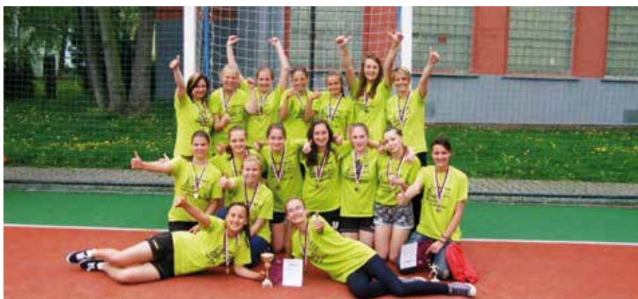
Dorostenky a starší žacky házenkářského týmu TJ Sokol Kyšice