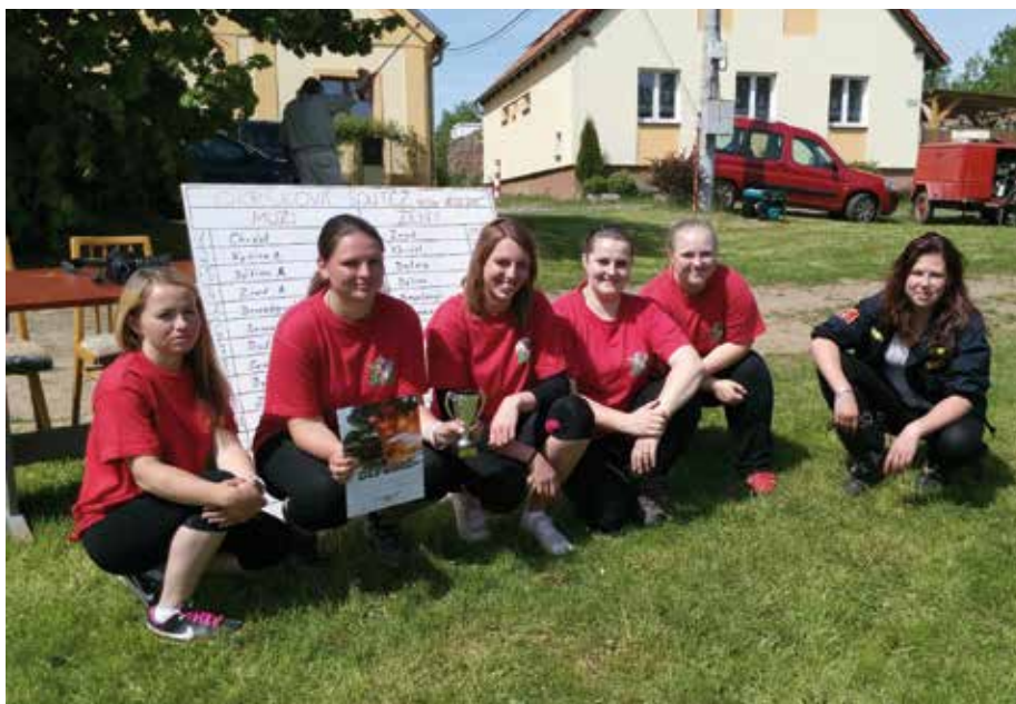
Dýšinské hasičky s pohárem za druhé místo v okrskové soutěži družstev