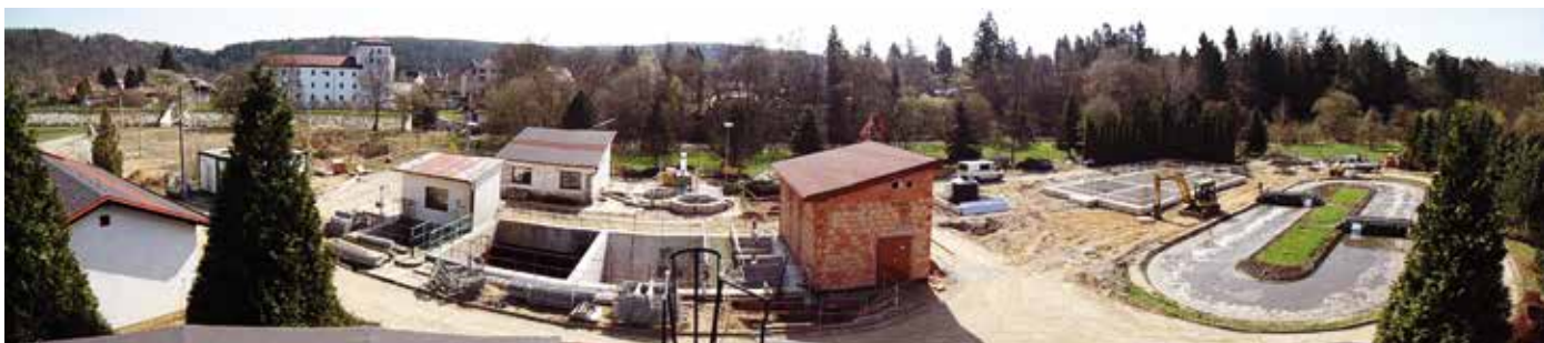
Celkový pohled na stavenišť ČOV a detailnější pohled od dosazovacích nádrží (foto nahoře).