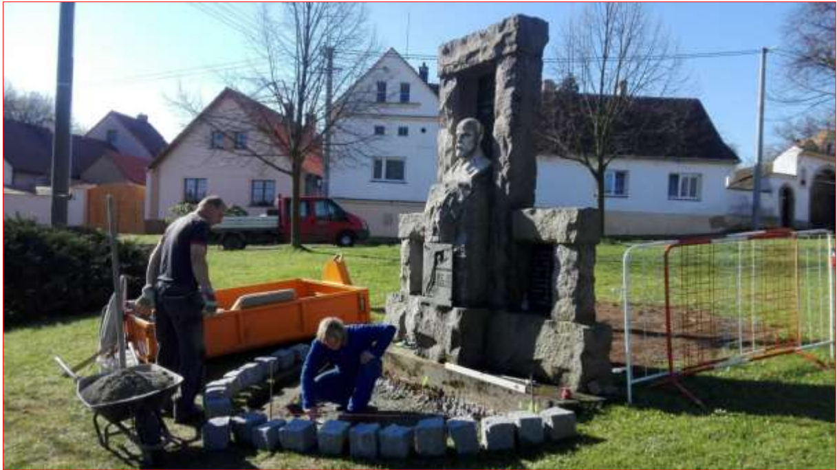
Stavba žulového předpolí pomníku