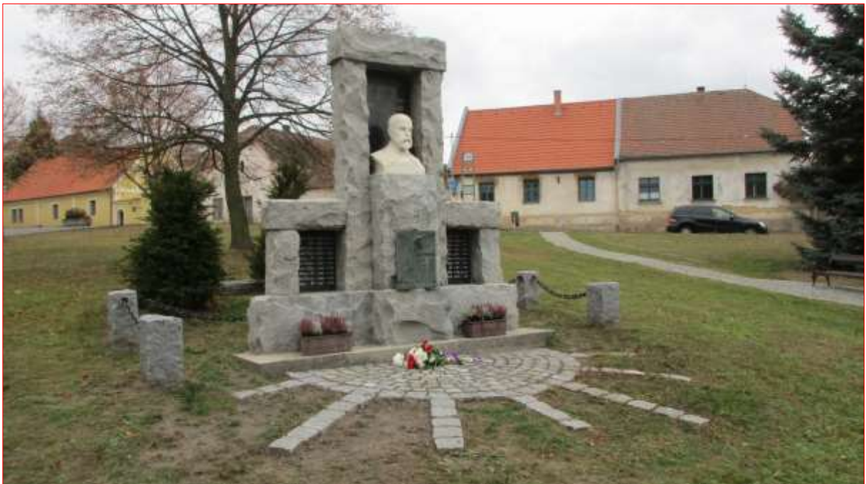
Odhalení nově restaurovaného pomníku a úpravy jeho okolí se stalo součástí připomenutí stého výročí vzniku Československé republiky 27. října 2018.

Pozn.: V současné době je RO schválená realizace další studie, věnované dýšinské návsi, viz: Zápis z 5. RO, konané dne 27. února 2023 , str. 5: „Rada obce schvaluje realizaci studie „URB Dýšina – návěs“ společností Jsme k světu s. r. o., IČ: 04832094, Pod Všemi svatými 100/69, 301 00 Plzeň dle předložené cenové nabídky za 182 750 Kč bez DPH “, viz: https://www.obecdysina.cz/e_download.php?file=data/uredni_deska/obsah2006_22.pdf&original=Z%C3%A1pis%20z%205.%20jedn%C3%A1n%C3%AD%20RO%2027.2.2023%20-%20anonym.pdf