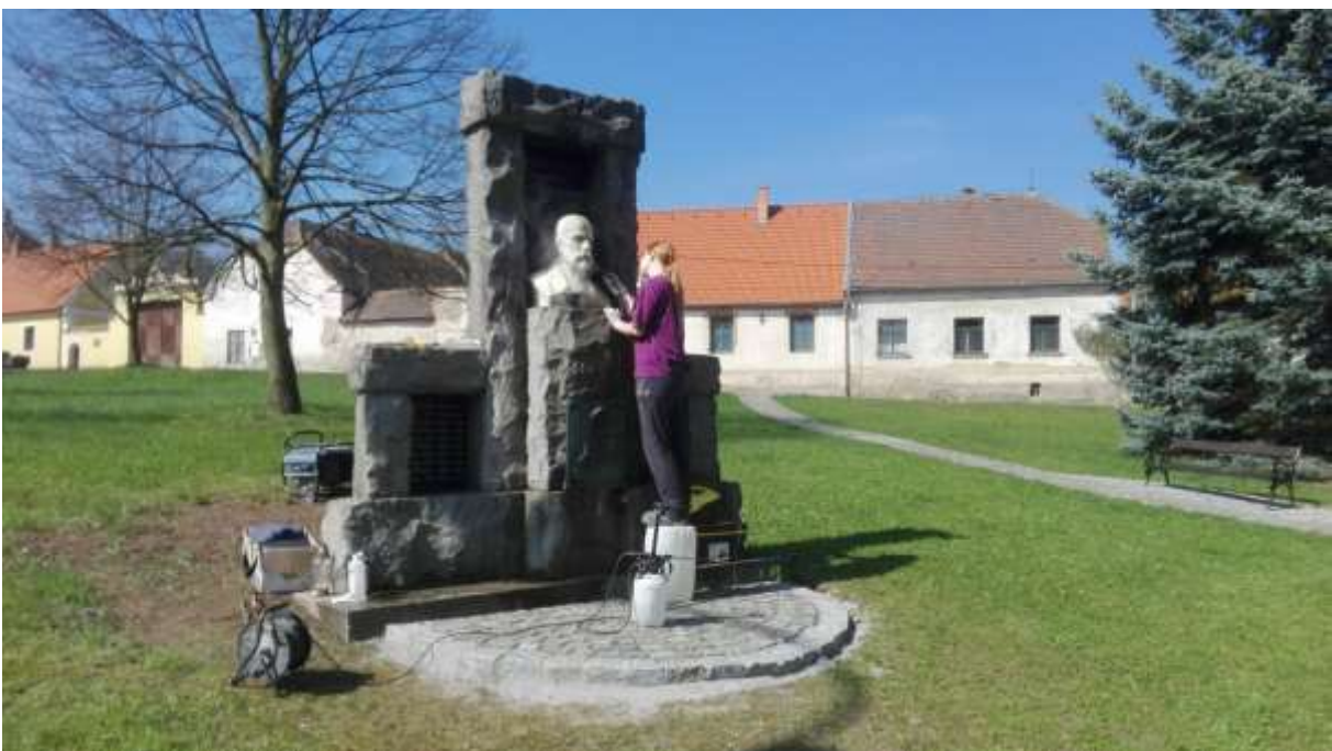
Očistění a restaurování busty, která byla v historii pomníku několikrát zachráněna zakopáním v zemi.