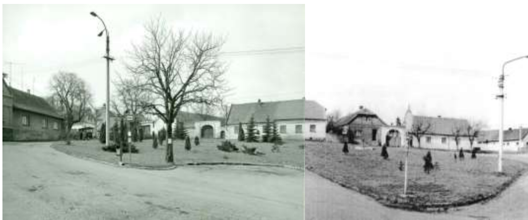
1987, Dýšinská náves, stav před přenesením pomníku na paměť obětí obou světových válek (dvě fotografie převzaty ze studie K. Fouda)

V souvislosti s přemístěním pomníku nelze nezmínit proměny návsi po roce 1967 . Nastává období velkého „bourání a budování“ . Náves byla od roku 1967 „prázdná“ – byla zbourána škola i hostinec u Šašků. (Pozn.: Dnešní zatravněná část má výměru ca 19 arů). S odstupem času ale není jasné, zda se postupovalo podle nějakého konkrétního záměru či studie. Postupně se zde střídaly výsadby růží, nesourodá výsadba nepůvodních zeravů (1987 viz foto níže, převzato ze studie K. Fouda), zbourání historických statků v západní i jižní části návsi, odstranění žulové dlažby a její nahrazení asfaltem, umístění kopie desky z děla věnovaného gen. E. N. Harmonem na malý pomníček, přesun autobusových zastávek, kácení stromů, opakované vysazení Stromu republiky, oprava studny a pumpy, která zde zůstala z historické zástavby atd.