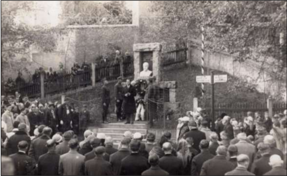
28. října 1928 – odhalení pomníku u historického schodiště na hřbitov

První republiku vystřídaly nacistická a posléze komunistická totalita. Obě byly neslučitelné se symboly demokracie, které měly být všechny odstraněny (tj. zničeny). Toto rozhodnutí se týkalo i busty TGM na pomníku u hřbitova. Opakovaně ji zachránili zdejší občané – vlastenci, kteří ji z pomníku tajně sejmuli a uschovali (tj. zakopali) na neznámém místě ( 1938 a 1948 ).