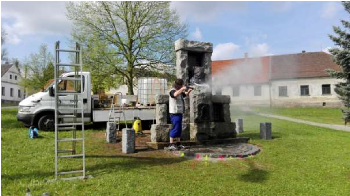
Čistění pomníku (možná poprvé v jeho historii?)

Byly odstraněny nekvalitní betonové desky před pomníkem a vytvoření předpolí z žulové dlažby. Následně došlo k zabudování žulových sloupků, litinových řetězů mezi nimi a za pomníkem výsadba dlouholetého tisu červeného. Při cestičce vpravo směrem k „adventnímu smrku“ byla ještě vydlážděná půlelipsová plocha pro postavení lavičky. Na úpravách se podílelo více lidí a firem, které odvedly kvalitní práci. Na návsi tak vznikl dlouho postrádaný důstojný prostor, jak je patrný z fotografií níže.