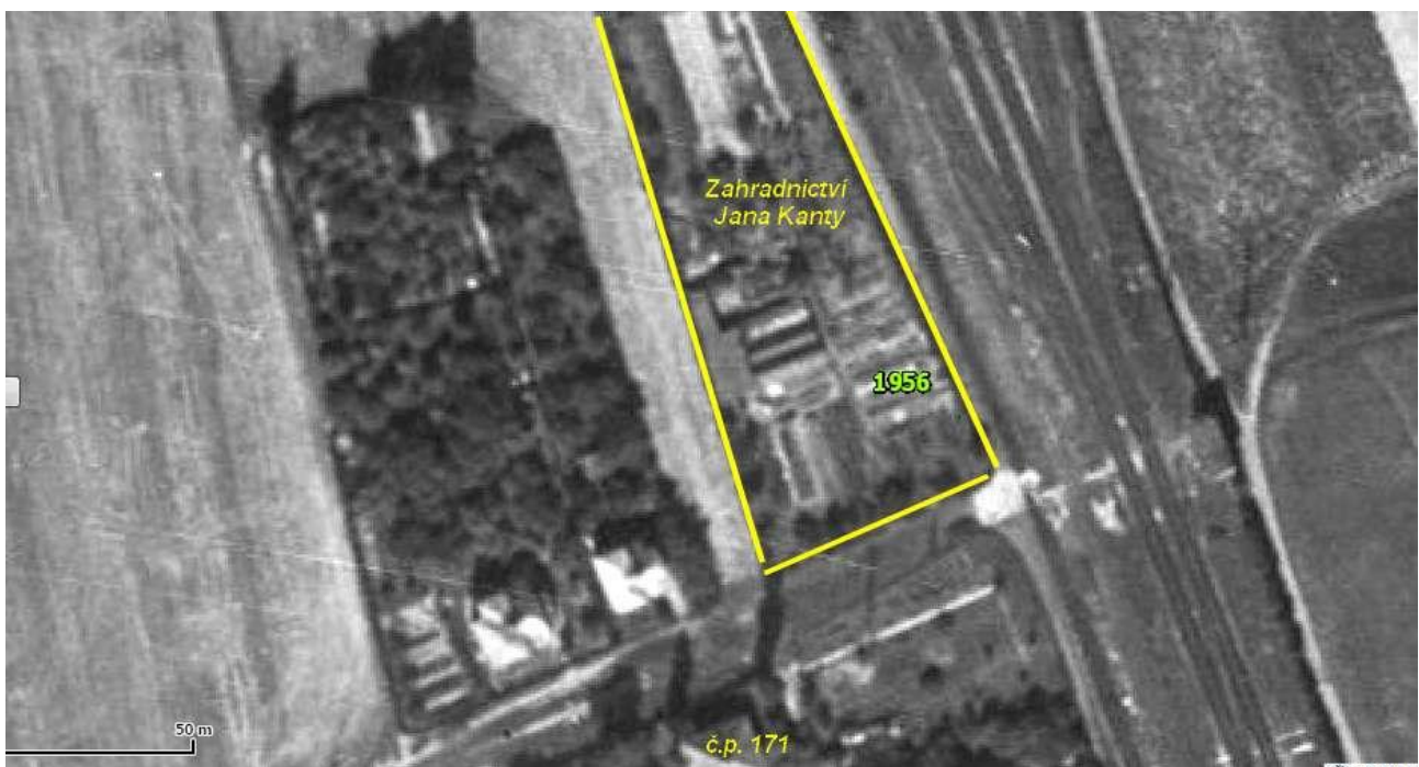
Umístění zahradnictví na snímku z roku 1956 Současný vzhled lokality