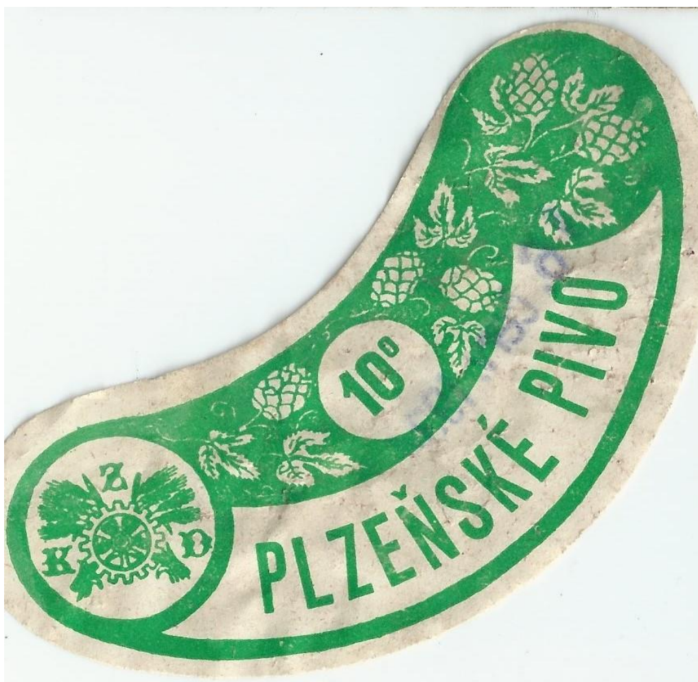
Etiketa z pивní lahve z roku 1934 – tedy z roku postavení domu (že by nějaký kolaudační večírek?)