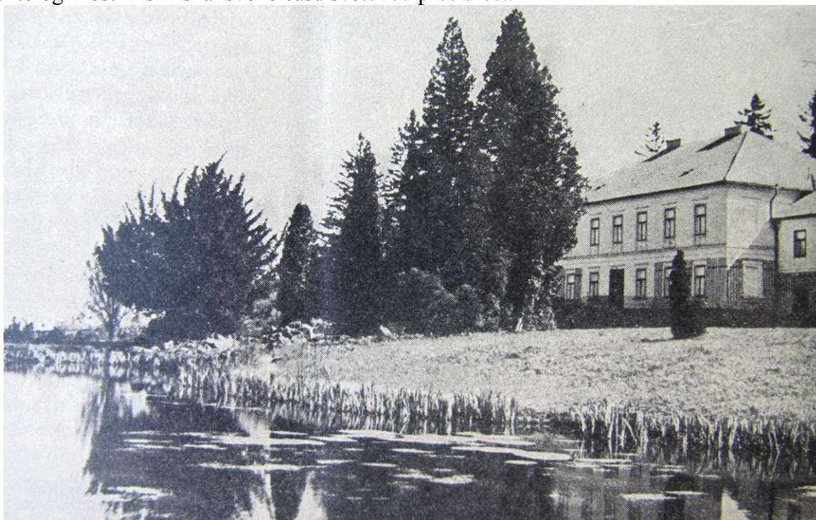
Zámek Březina s parkem kolem roku 1938

Nejznámějším z rodu Šternbergů byl hrabě Kašpar Maria Šternberk (1761–1838), vynikající přírodopisec, který se na svých cestách po Evropě přátelil s řadou velkých přírodopisců. Na zámek Březina přenesl své cenné sbírky botanické a paleontologické, založil tu botanickou zahradu s mnohými vzácnými a cizokrajnými rostlinami. Její zbytky tu ještě existují. Ve svých uhelných dolech na Radnicku studoval kamenouhelnou flóru. Velký spis Kašpara ze Šternberka o paleontologii rostlin si získal svého času světovou proslulost.