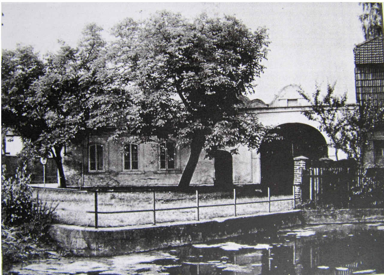
Usedlost 20, když ještě stálo obytné stavení