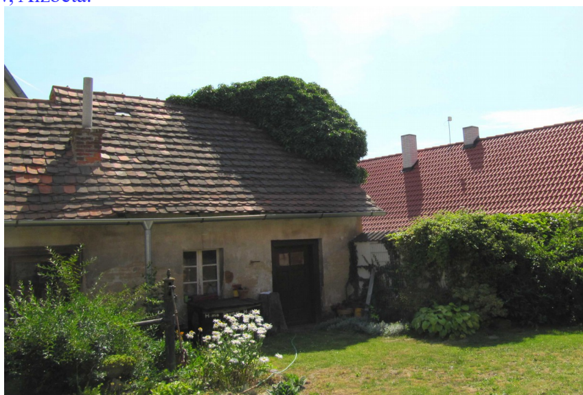
Na dvorku č.p. 50