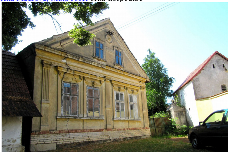
Průčelí obytného objektu se zajímavě členěnou fasádou...