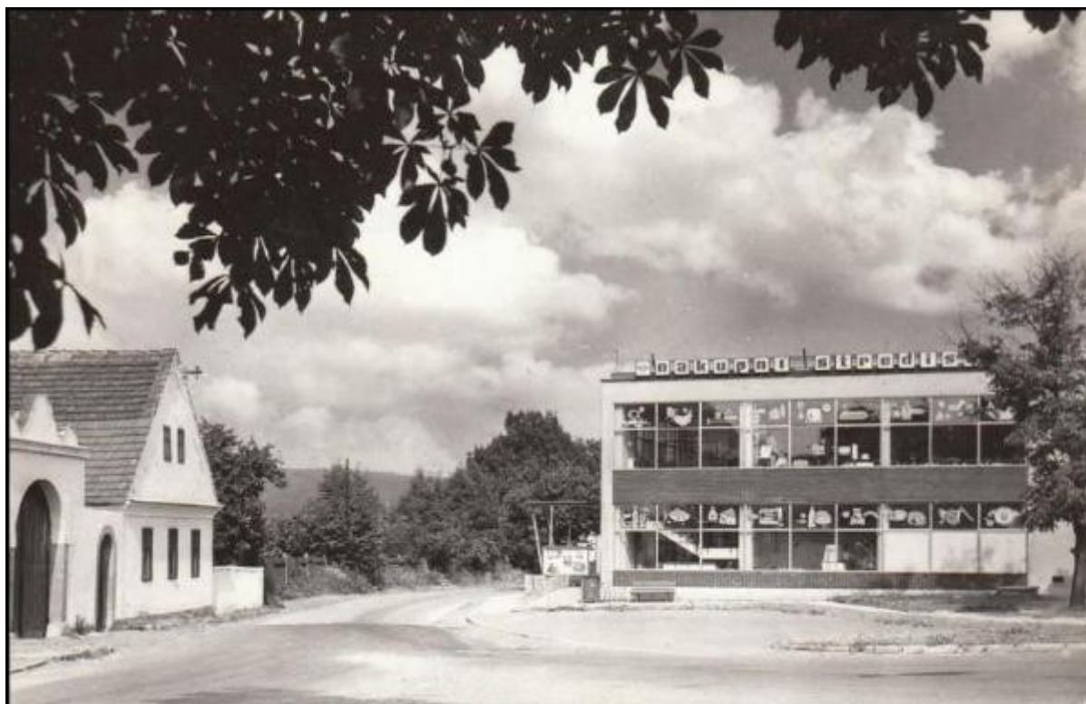
A ještě pár obrázků z prostoru návsi: