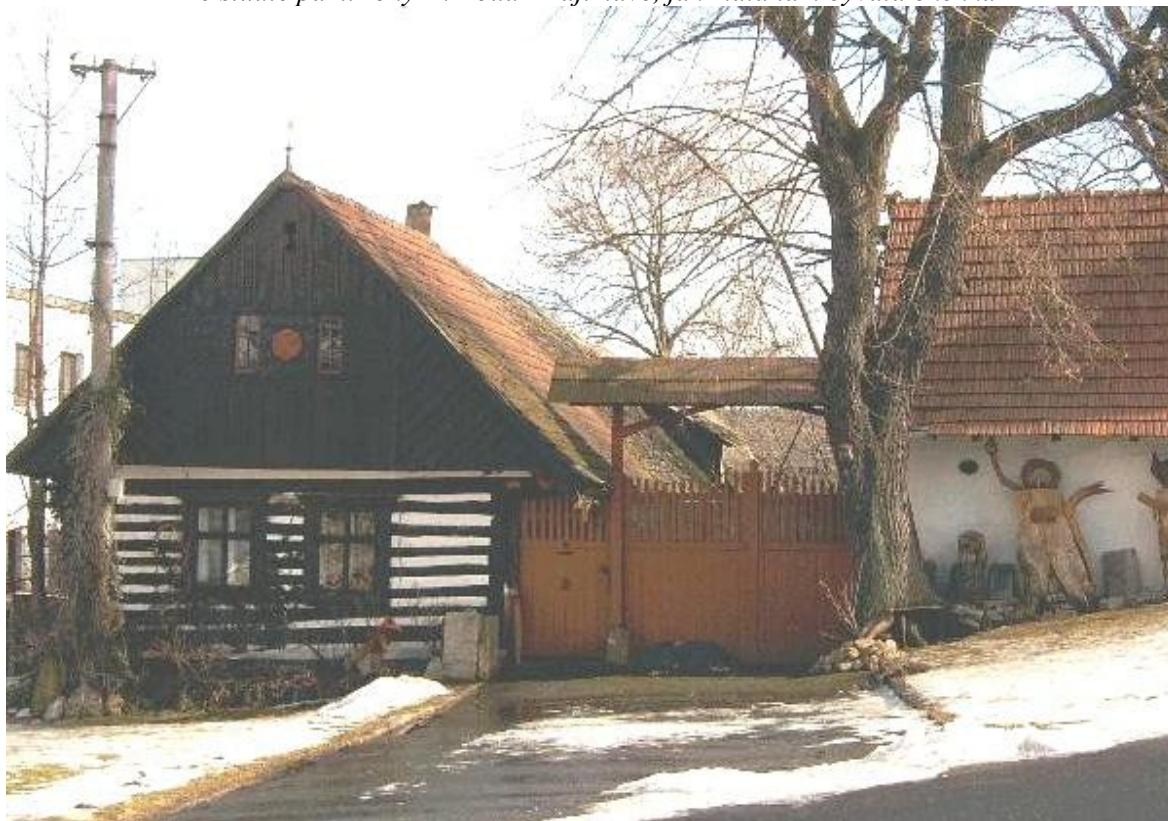
Roubenka – štít je novodobý a okna nepůvodní zvětšená. Stříška nad vraty nebývala.