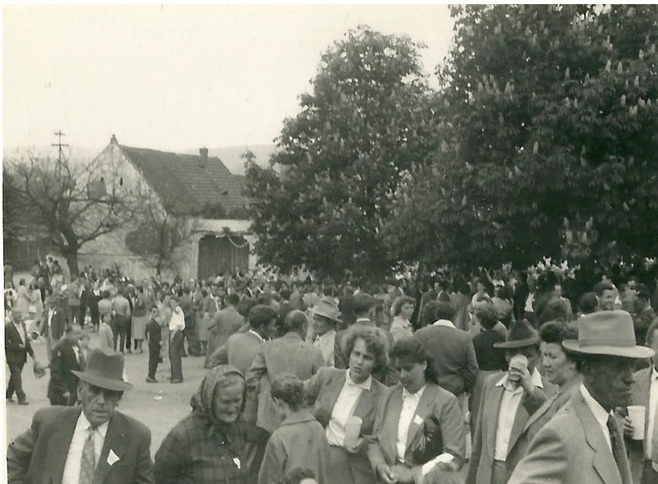
Slavnost na návsi, když ještě stála „devítka“ (poznáte někoho na fotografii?)