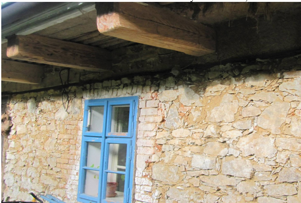
Chalupa je velmi zachovalá v původní podobě a prochází citlivou opravou