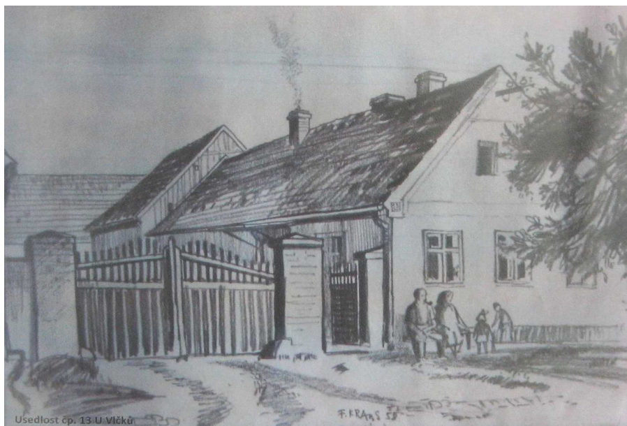
(vyfoceno na slavnostech 2015)