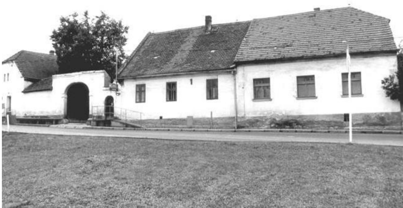
Foceno z obrázků na slavnostech 2015