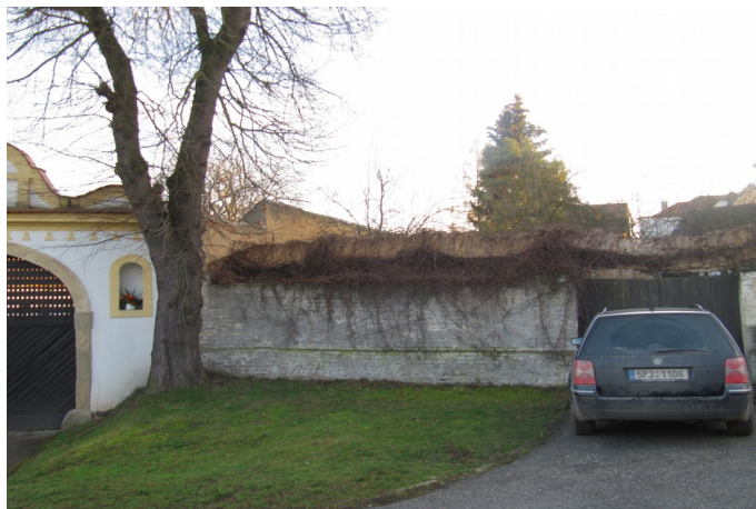
V místě zdi býval kdysi dávno dřevěný štít prvního č. 45.

Nová poloha č.p. 45 (dnes novodobý dům v poslední v řadě před Domem služeb):