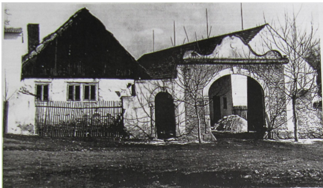
Usedlost č. 21 ( Foudova studie)