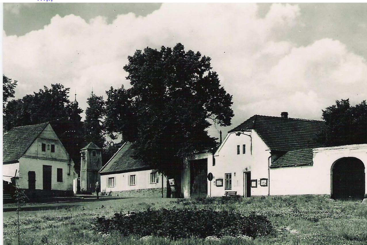
Pohled na náves ještě se starou lípou

Osoby ve výše uvedených odstavcích nemusí být vyloženě majitelé, ale lidé, kteří jsou u objektu psaní v různých listinách a knihách, protože platili poplatky, případně se jim tam narodily děti, jinými slovy tady žili a zanechali jakousi stopu. Informace jsou získané z veřejně přístupných zdrojů -archivy a digitalizované materiály. Popis historie a osoby zapsané v prvním díle obecní kroniky jsou částečně smyšlené a pak opakovaně opisovány různými autory bez ověření a udání zdroje a tedy nevěrohodné. Na to v kronice upozorňuje i Václav Čtrnáct.