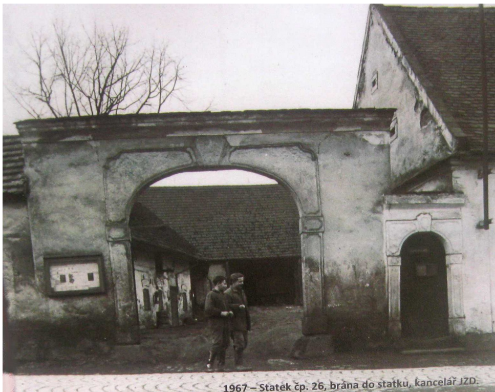
1967 – Statek čp. 26, brána do statků, kancelář JZD.