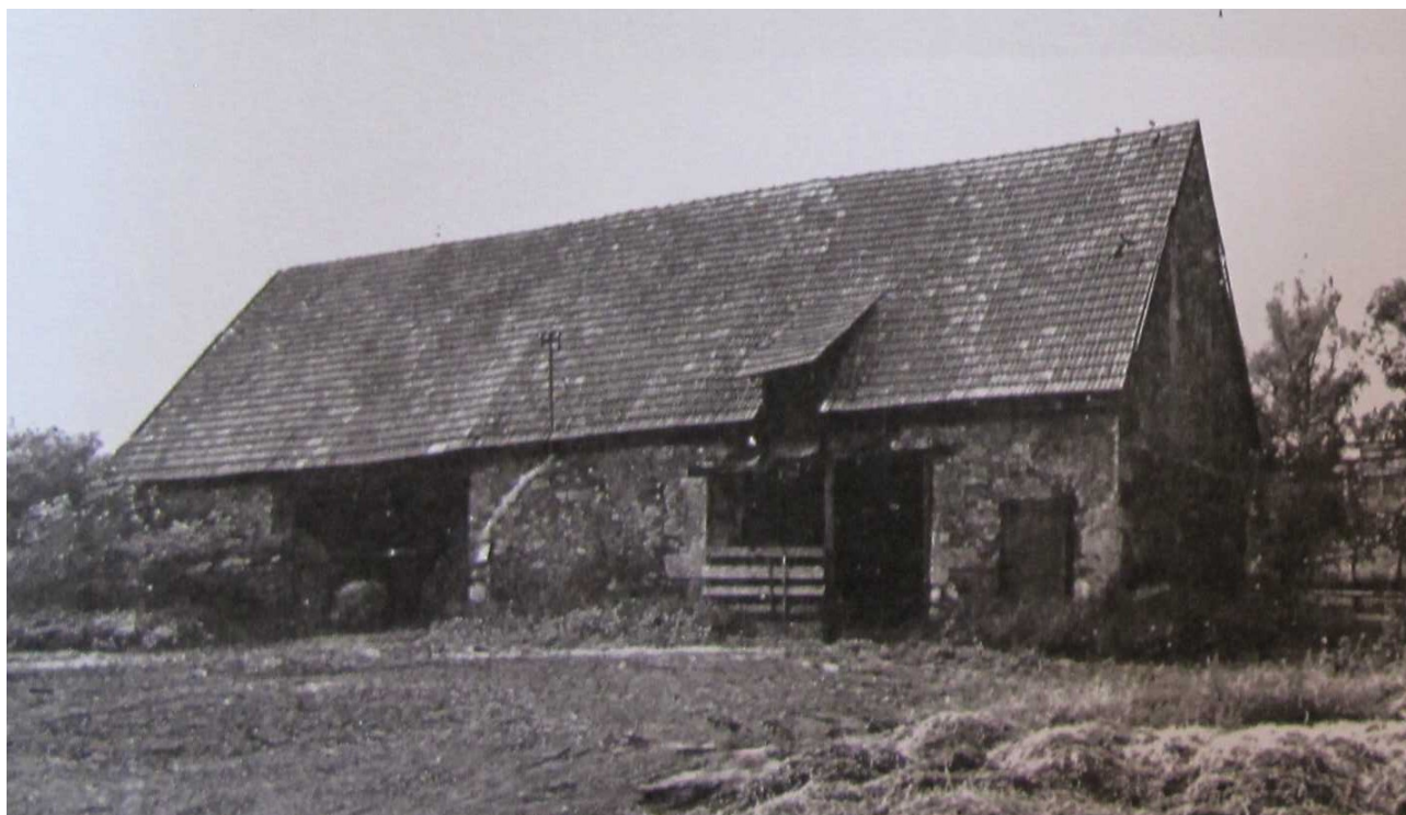
Stodola u stavení č.p. 23 – z Foudovy studie