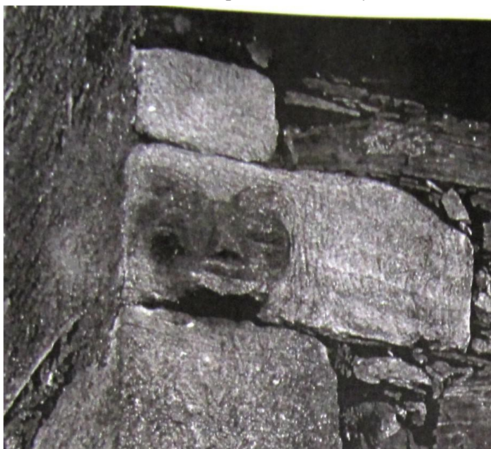
Reliéf, co býval na kameni stodoly – podle Fouda vyobrazení zvířete, podle mě čert – možná prastarý odkaz na pověst – snad někde tady ve dvoře stával onen kámen, co ho čert odnesl do lesa nad Hutí?

Statek byl po válce a kolektivizaci přidělen JZD a využíván jen částečně k hospodářským účelům. Nebyl nijak opravovaný a udržovaný a v podstatě byl postupně vybydlen a někdy po roce 1970 zbourán až na malý kousek výminku. Ten vzal za své při stavbě nového domu. Za ním je poslední zbytek bývalé slavné usedlosti – kamenná zeď.