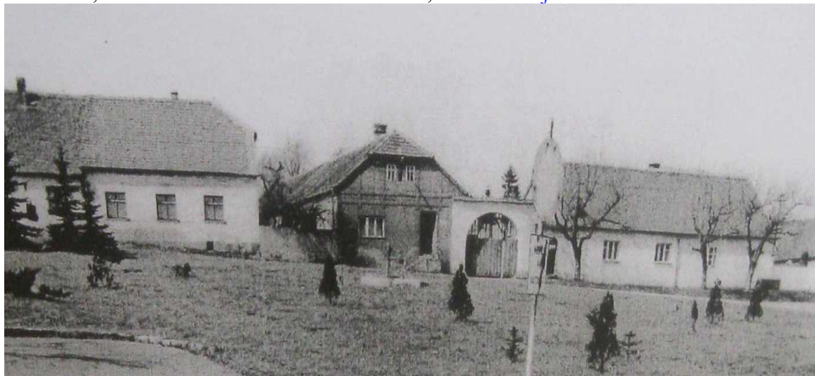
Nafoceno na slavnosti 2015