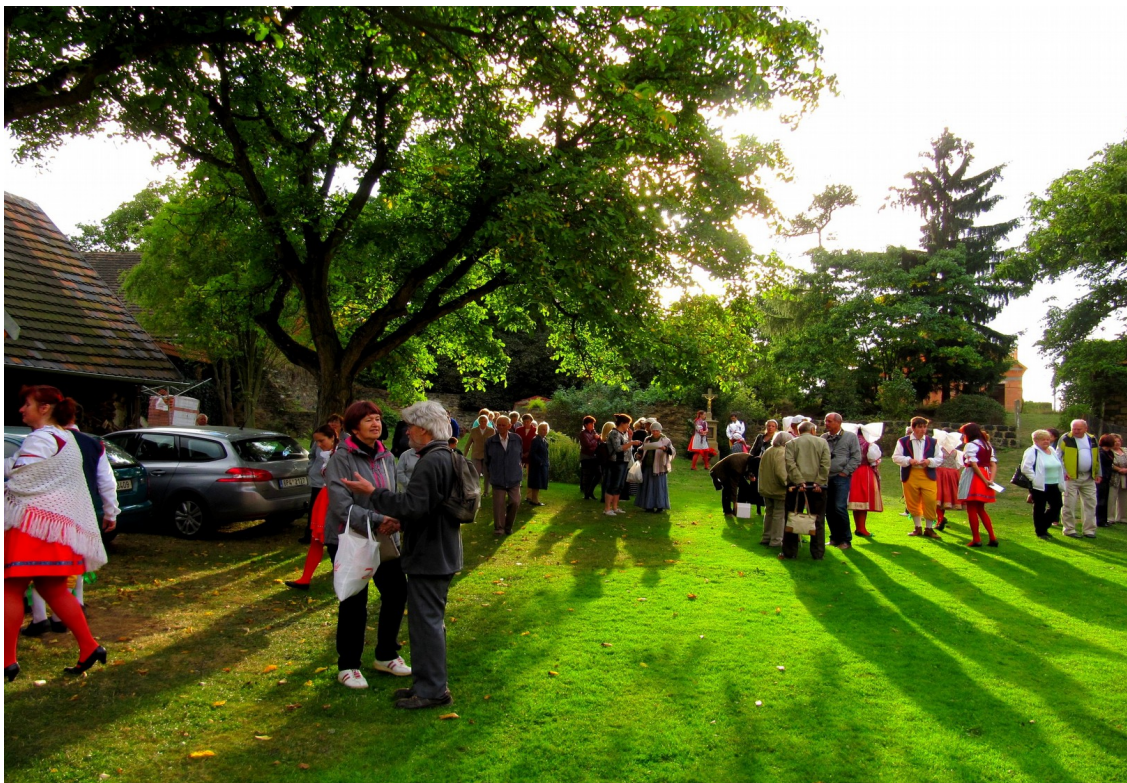
Ve dvoře č.p. 24 (podzim 2015)