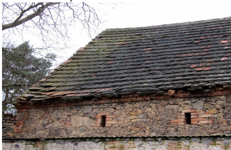
Kamenná stěna hospodářského objektu usedlosti č. 4.