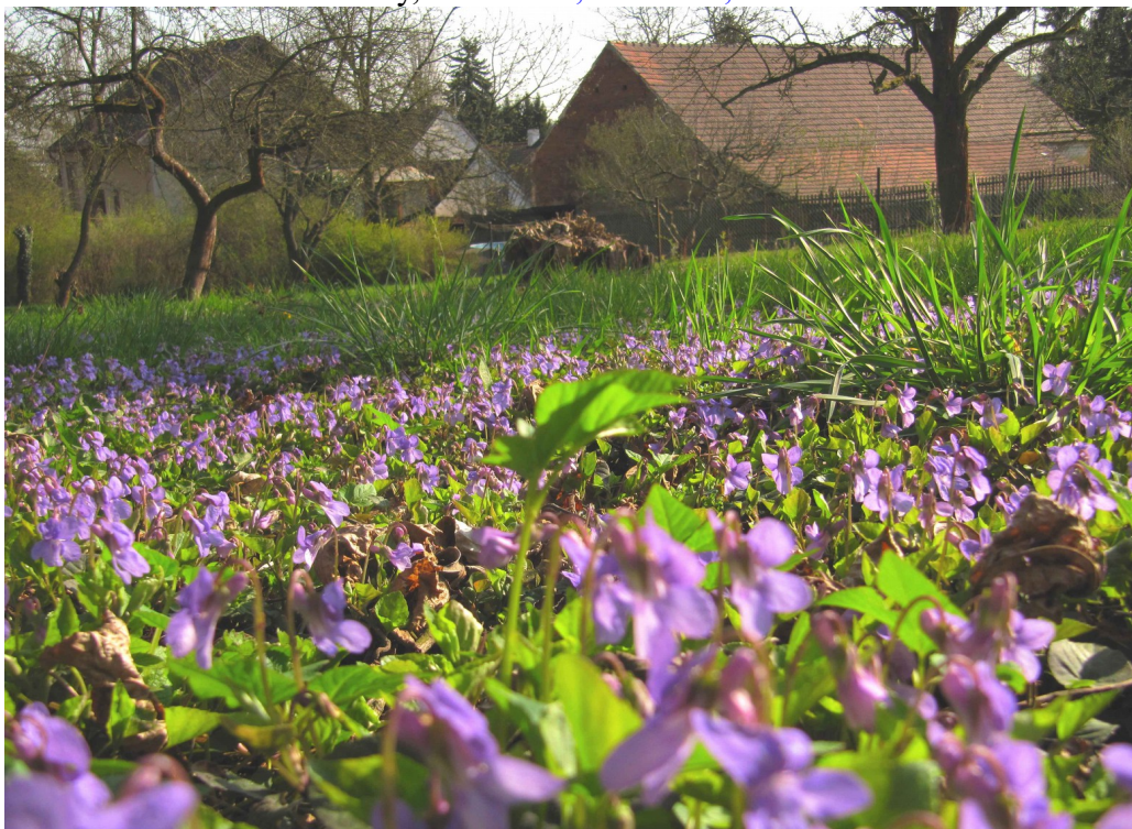
V zahradě čísla 11