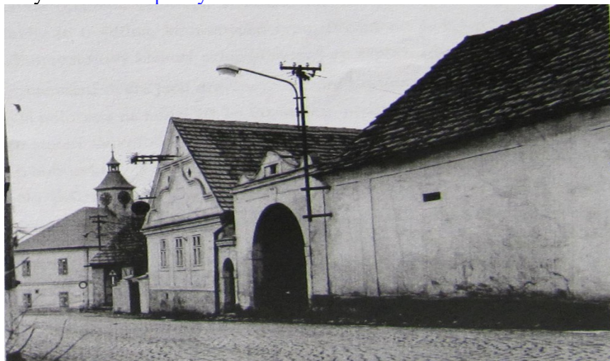
Č.p. 3 a stará škola na návsi (Foud studie)