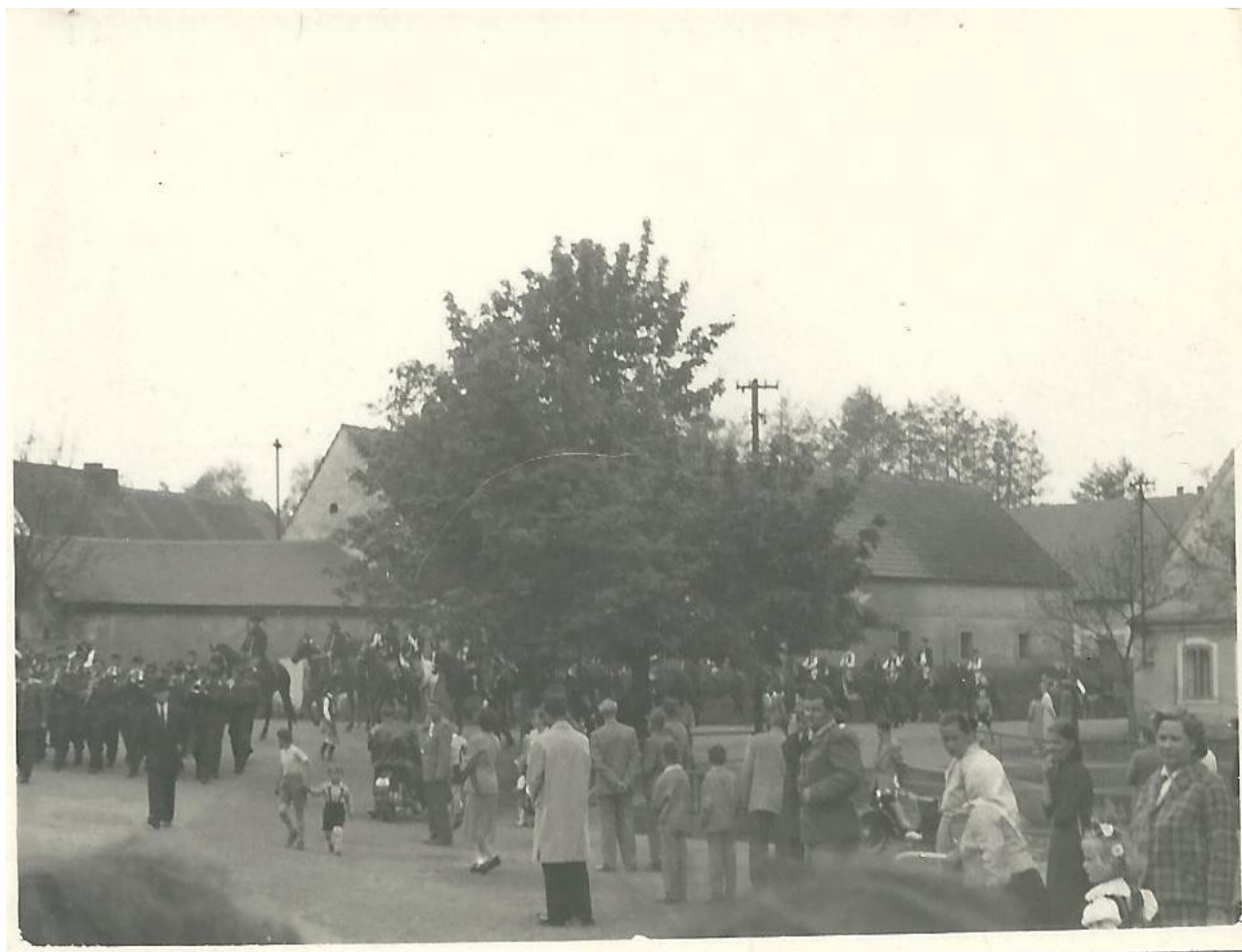
Pohled z návsi na prostor, kde v současnosti bývá pout' – javory u rybníka stojí stále