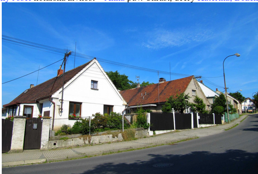
Chalupy č.p. 54, 55