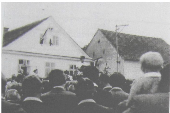
Chalupa ještě ve staré podobě se třemi okénky a vedlejší dům č. 4 ještě bez změny střechy