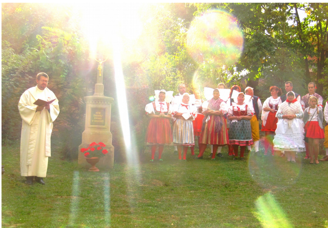
Úplně pohádkový dvůr – podzim 2015