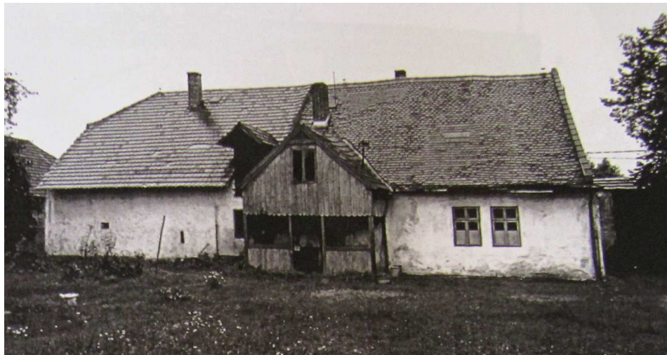
Z Foudovy studie