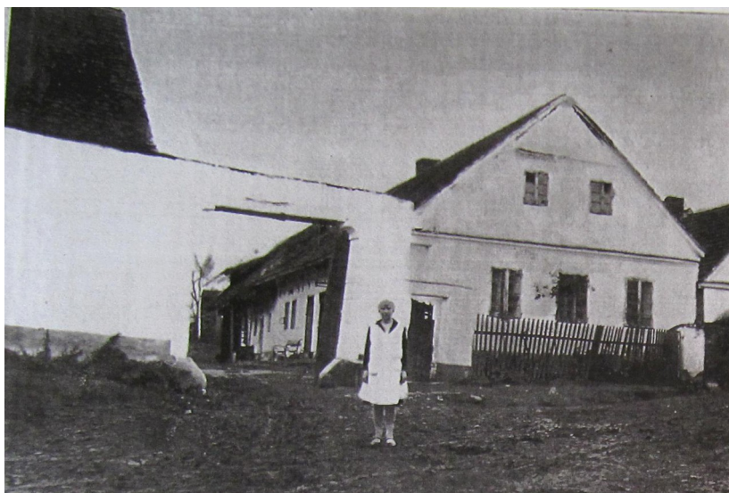
Z Foudovy studie