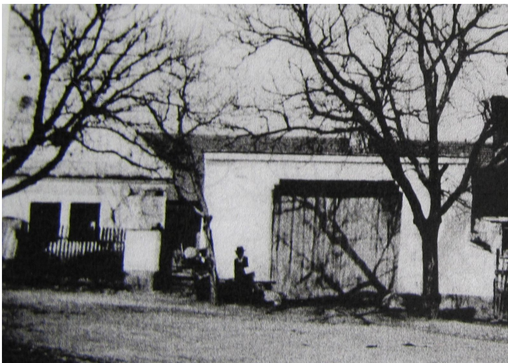
Usedlost č. 22 - z Foudovy studie

Osoby ve výše uvedených odstavcích nemusí být vyloženě majitelé, ale lidé, kteří jsou u objektu psaní v různých listinách a knihách, protože platili poplatky, případně se jim tam narodily děti, jinými slovy tady žili a zanechali jakousi stopu. Informace jsou získané z veřejně přístupných zdrojů -archivy a digitalizované materiály. Popis historie a osoby zapsané v prvním díle obecní kroniky jsou částečně smyšlené a pak opakovaně opisovány různými autory bez ověření a udání zdroje a tedy nevěrohodné. Na to v kronice upozorňuje i Václav Čtrnáct.