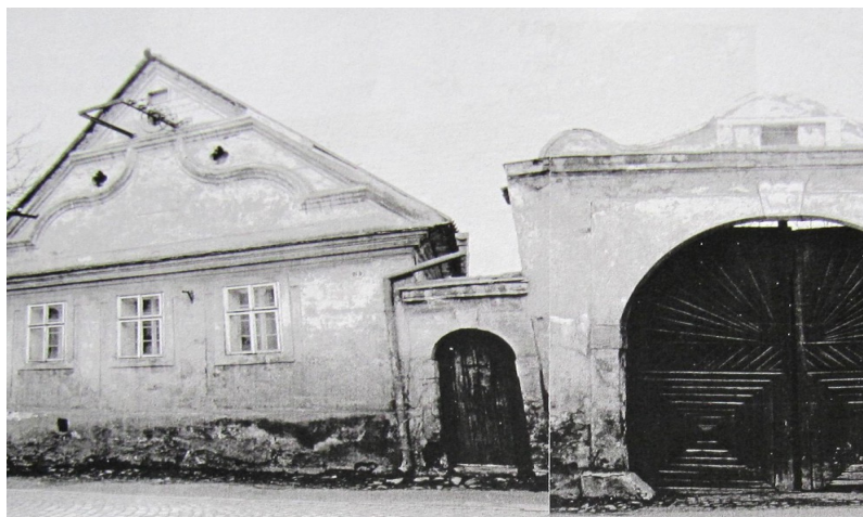
Brána a branka jsou z pískovce patrně místního s červenými železitými stopami. Říkalo se, že podobné kamenné prvky jako melouch dělali kameníci od dráhy kolem 1860