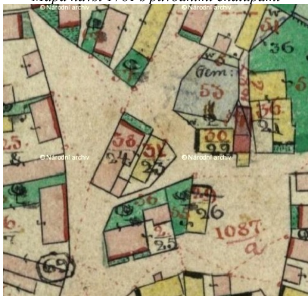
Mapa 1839 – na návsi je již škola č.p. 2, nové domy č.p. 36 a 38 . Na návsi zůstala jen čísla 29 a 31