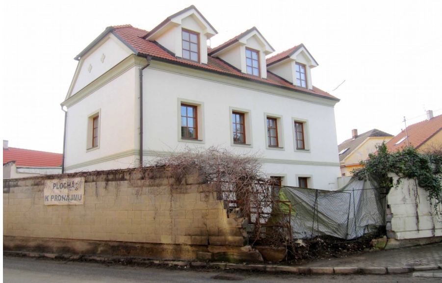
Dnešní podoba domu se zbouranou zdí po tragické dopravní nehodě