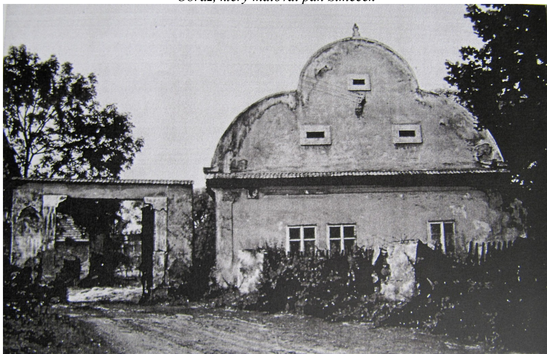
Obrázek z Foudovy studie