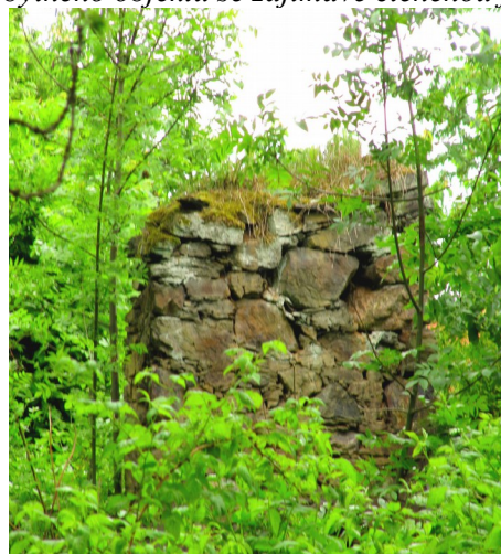
...a to, co zbylo ze stodoly – pohled z uličky vedoucí z bytovek na náves